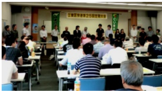
2015年度の新役員紹介

内務省はこれらの水害を直面して根本的な対策がせまられました。放水路をつくり、荒川の水を直接東京湾に流して江東地区を水害から防ぐ計画がたてられ、この工事が始まったのは1913(大正2)年です。