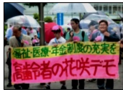
雨の中区役所までデモ行進

6月9日(火)12時より東陽公園で、江東区社会保障推進協議会主催の「第20回花咲デモ」が雨の中敢行され、14団体2