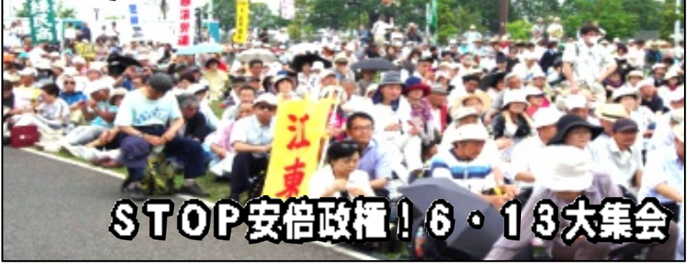
1万6千名が結集した大集会（東京臨海防災公園）に駆け付けた江東区のみなさん

「戦争法案」は廃案に 質問では「戦争法案」について、国会審議を通じても「憲法違反」は明らかであり、廃案を求めること。また、「憲法9条に基づく外交戦略の確立」「区の平和事業の拡充」など求めました。また、今年夏の中学校教科書採択について「正しい戦争」をやったな