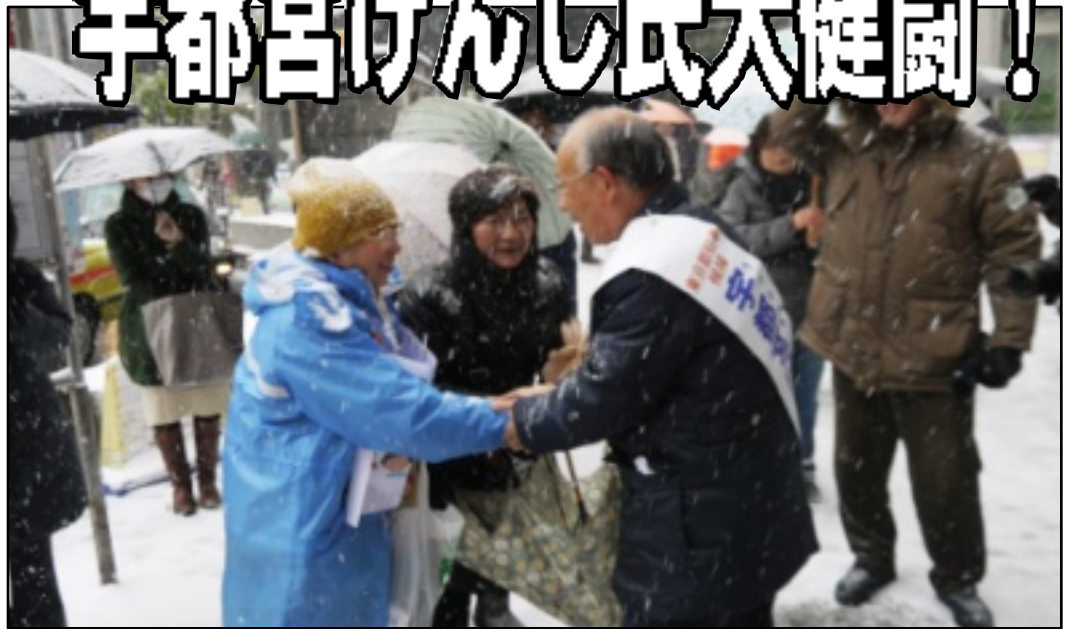
選挙戦最終日、大雪の中で支持を訴える宇都宮けんじ氏（JR 亀戸駅）