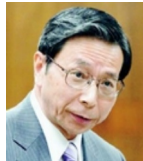
日本共産党 吉井衆院議員