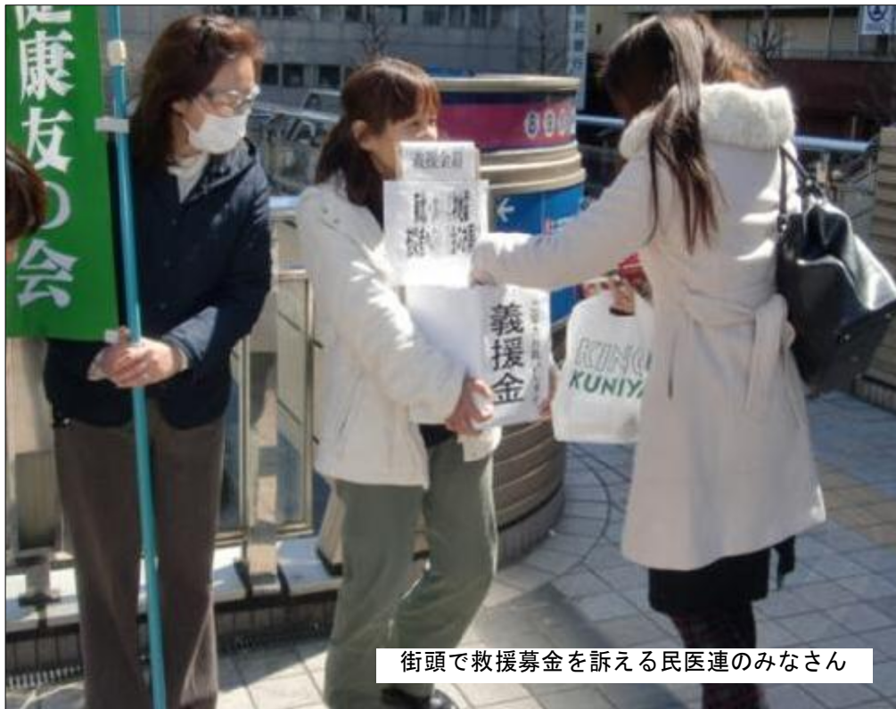
街頭で救援募金を訴える民医連のみなさん

大震災による被災者への救援と復興に向けての支援活動が広がっています。地震当日直ちに区内各所で避難所の開設と受入れ体制を整え、また帰ることができない父母を待つ子どもたちを深夜まで励まし支えた保育士など自治