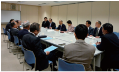
商店街連合会・産業連盟・商工会議所と懇談