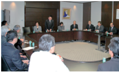
江東医師会と懇談