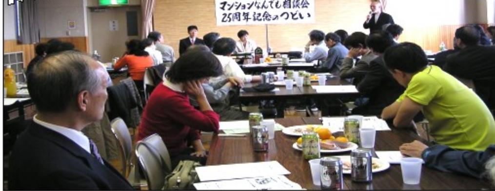
マンションなんて相談会 25周年記念のついで

11月15日、「マンションなんでも相談会25周年記念のついで」が東陽区民館で開かれ40人が参加しました。