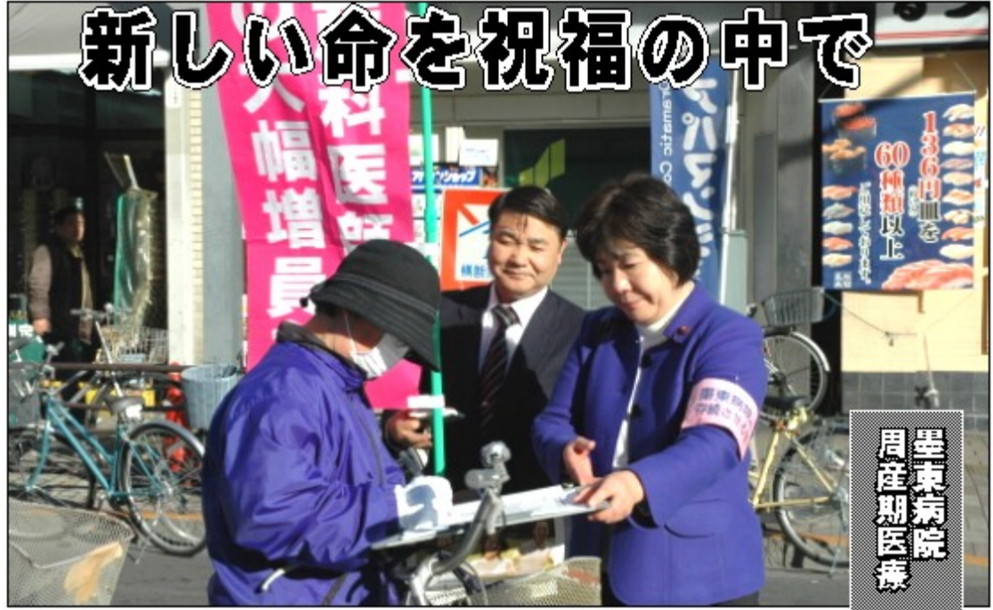
墨東病院 周産期医療