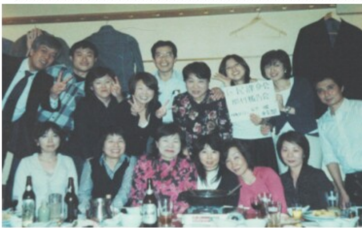
雇用守った日本コンベンションの仲間たち

公務員べらしのため民間労働者や地域住民との分断を企む公務員攻撃のもとで、公共サービスや保育水準を低下させないためにも、非正規職員が結集する公共一般江東支部は均等待遇を旗印に、区職労と協同し組合員を拡大、着実に要求を実現し、区民サービス充実に努力しています。